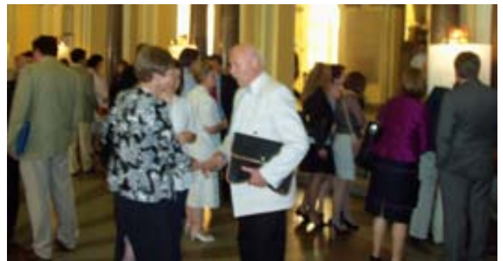
Konferencia az ELTE Jogi Karán a Magyar Közigazgatási Intézet 80. évfordulóján