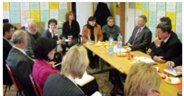
Műhelybeszélgetés a járásokról