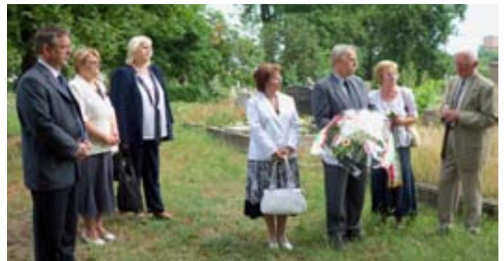
A Magyary konferencia napján a város vezetésével a temetőben is emlékeztünk névadónkra