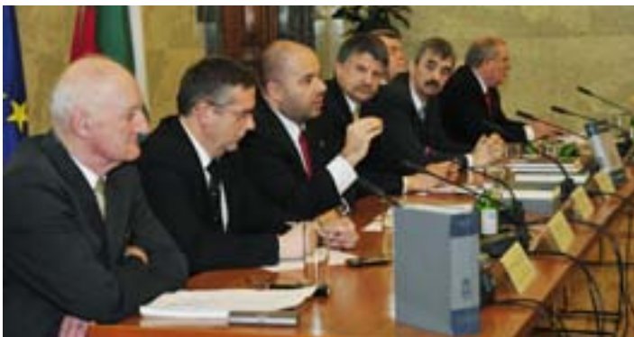
A Parlamentben került bemutatásra Magyary-Kiss könyv hasonmás kiadása