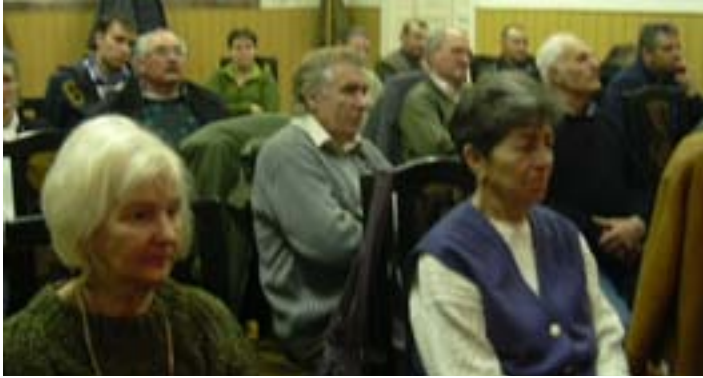
Takaró Károly előadásának közönsége a Helyőrségi Klubban