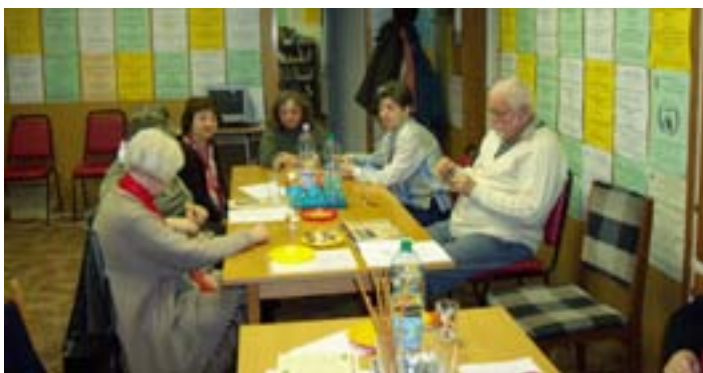
A népfőiskola klub tagjai közös témáról beszélgetnek